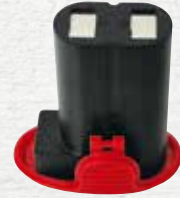
電池パック×2 ・7.4V(リチウムイオンバッテリー) ・充電時間約2時間