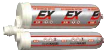
樹脂カートリッジ EX-350