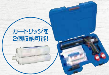
収納や持ち運びに便利なケース付