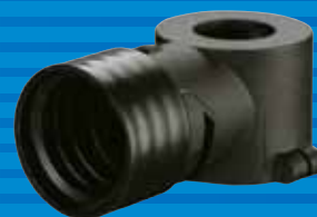
品番 PQ-AD 標準価格 6,800円 (税抜き)