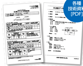
▲サンコーテクノ社名入り表紙付き技術資料がダウンロードできます。 ・製品仕様図(組立図) / 製品仕様書 / 材料規格書 / 試験成績書(引張・せん断)