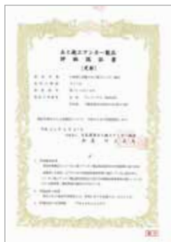
▲CAD データ (DXF 形式) や JCAA 認証書がダウンロードできます。